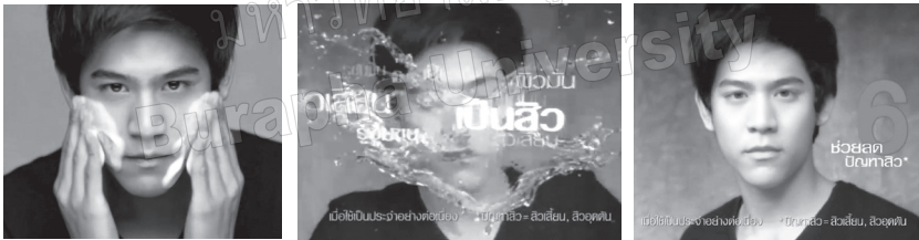
ภาพที่ 3 แสดงตัวอย่างเรื่องราวในโฆษณาผลิตภัณฑ์การ์นิเย่ เมนแอดโนไฟท์โพน โดยให้เทคนิคการนำเสนอแบบการใช้การสาธิต

หรือในกรณีผลิตภัณฑ์เจลแต้มสิว Smooth E Ache Hydrogel มีการใช้การสาธิต เพื่อให้เห็นประสิทธิภาพการทำงานของผลิตภัณฑ์ด้วยสูตร Maximum Strength ช่วยให้สิวลุดตันยุบตัวลงอย่างรวดเร็ว ซึ่ง บดินทร์ เดชาบุรณานนท์ (2558, หน้า 133) กล่าวว่า การสาธิตแบบกราฟิกใช้กับสิ่งที่ไม่สามารถมองเห็นได้ด้วยตาเปล่า อาจเป็น สิ่งที่อยู่ภายในซึ่งไม่สามารถสาธิตให้เห็นภายนอกได้ เช่น การสาธิตการไหลเวียน ของน้ำมันเครื่อง การสูบฉีดของเครื่องยนต์ ตัวอย่างเช่น โฆษณาน้ำมันเครื่องเอสโซ่ (Esso) ใช้การสาธิตแบบกราฟิกโดยเป็นการผ่าเครื่องยนต์ให้ดู เพื่อแสดงให้เห็น การเคลื่อนที่อย่างรวดเร็วของน้ำมันเครื่อง ซึ่งเข้าไปทำงานเพื่อปกป้องคัมครอง เครื่องยนต์กลไก