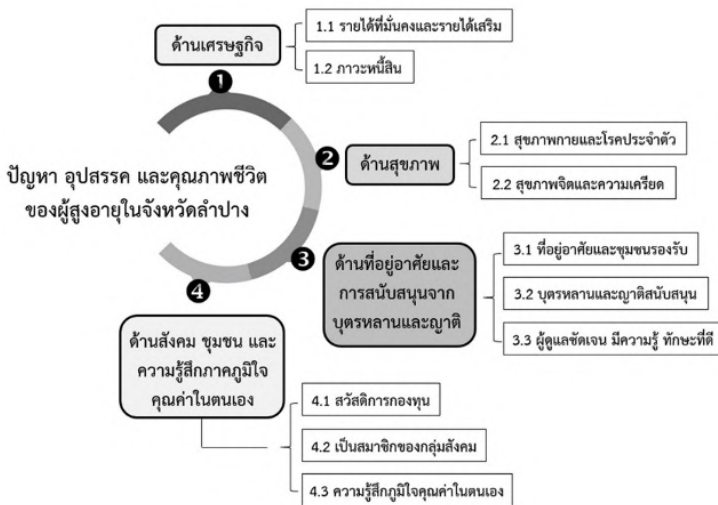
แผนภูมิที่ 2 แสดงผลการศึกษาปัญหา อุปสรรค และคุณภาพชีวิต ของผู้สูงอายุในจังหวัดลำปาง

ผู้สูงอายุและหน่วยงานที่เกี่ยวข้องกับการพัฒนาคุณภาพชีวิตของผู้สูงอายุ ขั้นตอน ที่ 3 การสร้างแนวทางการใช้สื่อสังคมออนไลน์ที่เหมาะสมเพื่อพัฒนาคุณภาพชีวิต ของผู้สูงอายุในจังหวัดลำปาง ใช้การสนทนากลุ่มย่อย (Focus Group) และการฝึก อบรมเชิงปฏิบัติการ (Workshop) เพื่อเพิ่มพูนความรู้ แลกเปลี่ยนความคิดเห็นของ ผู้สูงอายุและหน่วยงานที่เกี่ยวข้องกับการพัฒนาคุณภาพชีวิตของผู้สูงอายุในจังหวัด ลำปาง และร่างคู่มือการใช้สื่อสังคมออนไลน์ที่เหมาะสมเพื่อพัฒนาคุณภาพชีวิตของ ผู้สูงอายุในจังหวัดลำปาง ขั้นตอนที่ 4 การวิพากษ์แนวทางการใช้สื่อสังคมออนไลน์ เพื่อพัฒนาคุณภาพชีวิตของผู้สูงอายุในจังหวัดลำปาง ใช้การสัมภาษณ์แบบเจาะ ลึก (In-Depth Interview) กับกลุ่มผู้เชี่ยวชาญ ซึ่งมีประสบการณ์ด้านการพัฒนา คุณภาพชีวิตของผู้สูงอายุ เพื่อหาข้อสรุปในการจัดทำคู่มือการใช้สื่อสังคมออนไลน์ ที่เหมาะสมเพื่อพัฒนาคุณภาพชีวิตของผู้สูงอายุในจังหวัดลำปาง คณะผู้วิจัยจึงนำ เสนอผลการวิจัยตามวัตถุประสงค์ของการวิจัย ดังนี้